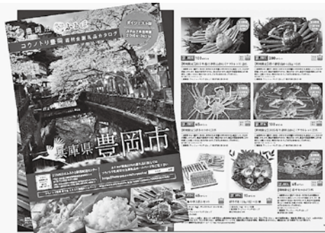
豊岡市のお礼品のカタログ

金があくなるんじゃ。それに、最近では、ふるさと納税のお礼に、地元の特産品を返す町が増えてな、テレビや雑誌などで取り上げられて全国的にブームとなつとるんじゃよ。豊岡市でも、平成26年12月から豊岡靴や但馬牛、津居山かなど、豊岡自慢の品々をふるさと納税のお礼として返すことにしたんじゃ。それ以降、徐々に増えてきて、本年度は全国の4千人を超える方から応援してもらつとるんじゃ。