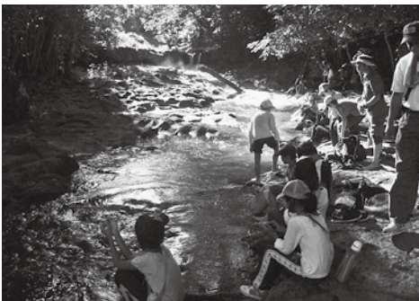
▲神鍋溶岩流(体験学習)