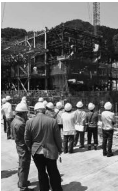
▲5月10日に開催した第1回現場見学会