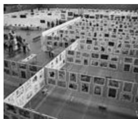
第65回美術展の様子

但馬地域最大の公募展。今年は新豊岡市誕生10周年にちなんで「合併10周年記念賞」が加わります(※一般部門、高校部門のみ)。