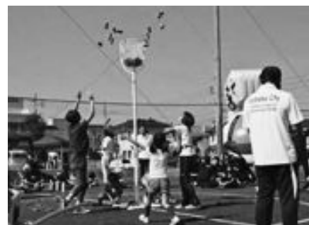
アジャタ大会運営(スポーツフェスティバル)

具体的には、体育の日に開催する「とよおかスポーツフェスティバル」の企画運営や誰でも気軽に楽しめる「ニュースポーツ」の普及・指導、各種スポーツイベントの開催や、地域での運動会・球技大会などの運営支援を行います。各種団体への指導も行いますので、体を動かしてみたい