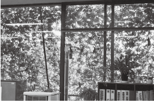
グリーンカーテンで夏を快適に