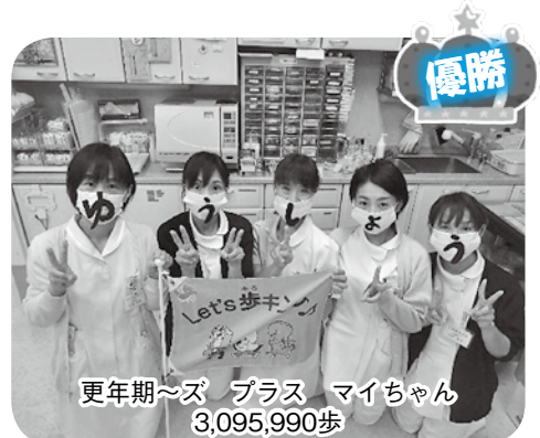
更年期~ズ プラス マイちゃん 3,095,990歩