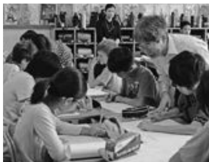
▲城崎小学校でのモデル授業(H26)