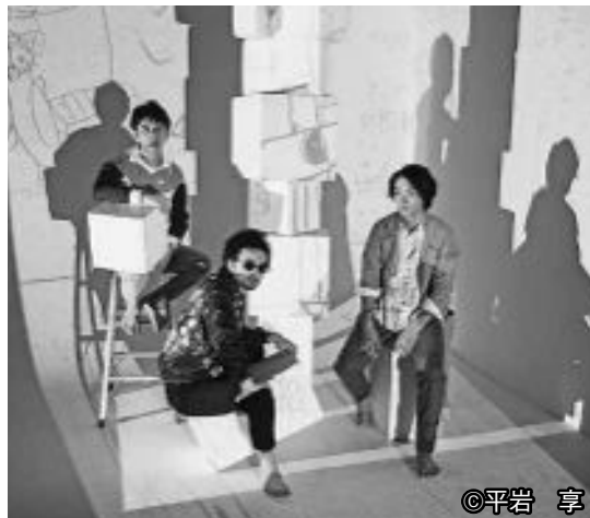
▲コドモ発射プロジェクト「なむはむだはむ」

《問合せ》城崎国際アートセンター ☎32-3888(受付:午前9時~午後5時) FAX32-3898 メール info@kiac.jp 休館日:火曜日、12月29日~1月3日