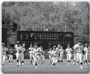
▲ここのとりスタジアムの人工芝の上を走る中学生