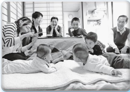
▲とよおか家族の日写真コンクール