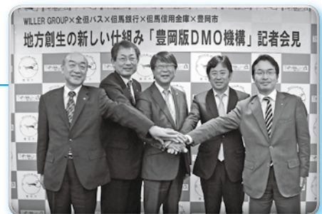
▲DMO機構設立準備記者会見(2月18日)

観光に着目したまちづくりを進める組織(DMO)として「一般社団法人豊岡観光イノベーション」を設立しました。民間と行政が協力して、観光客のニーズの分析や宿泊予約サイトの運営などを行っています。地域の事業者などと協力し、地域の素晴らしい素材を開発し、磨き上げて、観光客に豊岡の良さを伝えることで、地域の事業者がどんどん稼いでいける仕組みづくりを目指します。