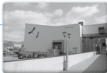
▲現在の配置・機能を維持する市民会館

公共施設の建て替えなどに伴う多額の財政負担を軽減させ、施設保有量の最適化(総量縮減)を実行していくため、公共施設再編計画を策定しました。また、公共施設(いわゆるハコモノ)、インフラ施設(道路橋りょう等)、公営企業施設(上下水道施設)の基本的な考え方と管理の方針を示した公共施設等総合管理計画も策定しました。