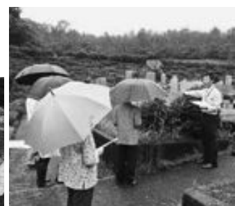
▲昨年の案内会の様子