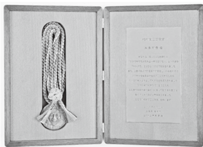
▲植村直己冒険賞 盾・メダル