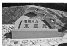
▲東霊苑シンボルサイン