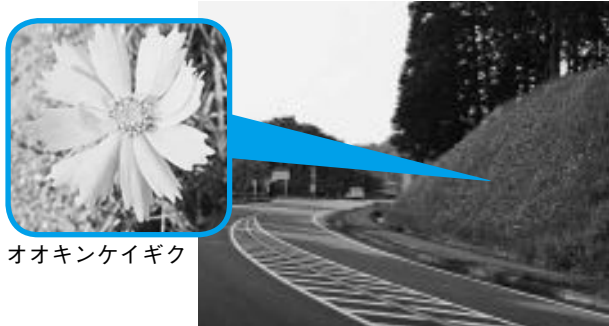
オオキンケイギク

5月下旬頃、国道312号線沿いに蓼川大橋から下流に数km、国道426号線沿いに天神橋～円山大橋間は、オオキンケイギクで一面が黄色に染まり、まるでお花畑です。庭や畑に植えている人もあると思います。でも、そんなことをしたことがある人、しようと思っている人、ちょっと待ってください。実は、新たに庭に植えて