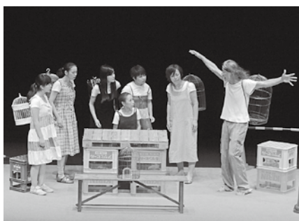
▲2016年内藤裕敬作・演出「豊岡駅前小鳥店Ⅲ」

私も、友だちと何か観に行きたいな。今年の夏、秋は豊岡でいろいろなお祭りに出会う季節だね！