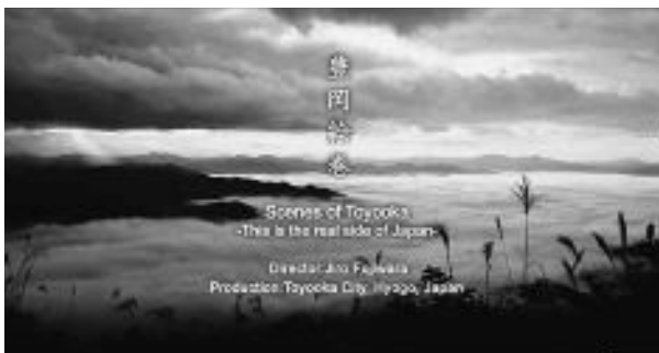
▲ワールドメディアフェスティバル2016の「旅行観光PR部門」で金賞を受賞した「豊岡絵巻」

映像を通じて、それぞれの地域の素晴らしさを伝え「行ってみたい、住んでみたい」と思ってもらおうと同時に、今、そこに住む人たちに、自分たちの地域の素晴らしさを再認識するために、「ふるさとスケッチ」を制作してきました。