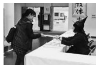
▲昨年の受付の様子