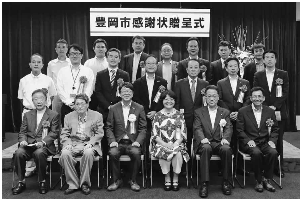
贈呈式後の記念撮影