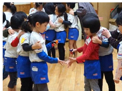
▲ Rock, paper, scissors, 英語でじゃんけん列車 (城崎こども園)