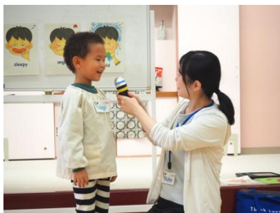
▲ How are you? 今日の気分は「Happy!」 (みかたの森こども園)