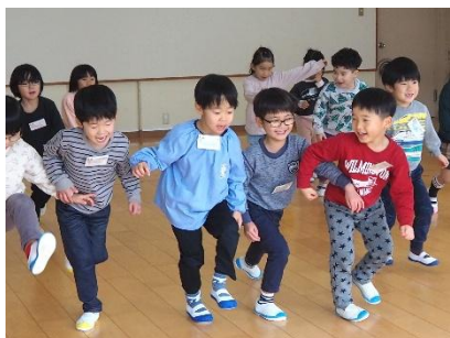
▲ みんなで進むよ、one, two, three! (合橋認定こども園)