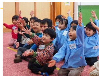
▲ Baby Shark ダンスを踊ろう! (出石愛育園)