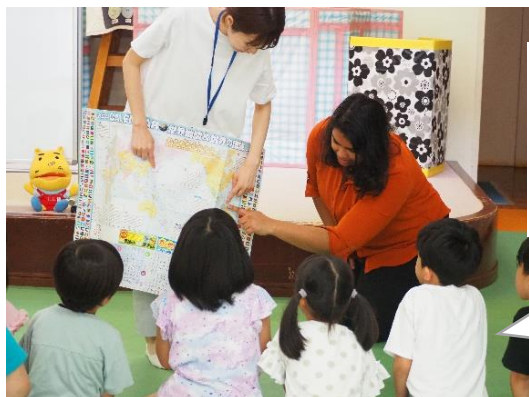
▲先生はどこから来たのかな? (八代保育園)

“Let's make a star!” と呼びかけると、「一緒にやろう！」と誘いあって、友達同士で協力して形づくりに取り組む姿がありました。「見て見て」って言って、先生やお友達にたくさんほめてもらえたね。