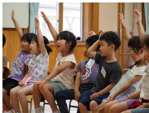
▲やってみたい人？「はい！」 (おさかおのこども園)

英語遊びの経験が「外国の言葉や文化に興味を持つ子に」「喜んで人と関わろうとする子に」「自己肯定感を持てる子に」につながるようにと考えています。子ども達の様子について、巡回指導の際にお伝えきれないことも、園訪問やお便りを通して、園の先生方と共有していければと思っています。どうぞよろしくお願いいたします。