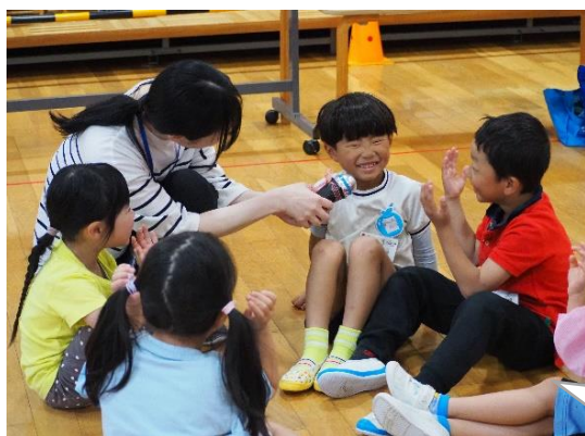
▲ Hello! What's your name? (竹野認定こども園)

最初は初めての英語にドキドキしていた子ども達が、みんなの前で「言いたい！」と手を挙げてみたり、自信のなかったダンスを褒められて、得意な気持ちになったり・・・英語遊びには、指導員も先生も、子ども達もうれしい場面がたくさんあります。先生方と一緒に、子ども達のうれしい気持ちや、楽しい気持ちに寄り添いながら、より良い英語遊びにしていきたいと思います。