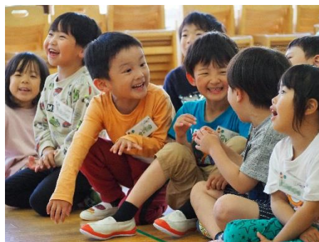
▲何色かな？ほらやっぱり green だ！ (西保育園)