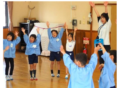
▲身体をうごかそう Up! Up! (八条認定こども園)