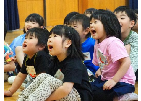
▲はじめての英語遊び（竹野認定こども園）

英語遊びを楽しみにしてもらえよう、指導員一同、子どもたちの気持ちに寄り添いながら巡回指導を行います。お気づきのことがありましたら、気軽にお声掛けください。よろしく願いいたします。