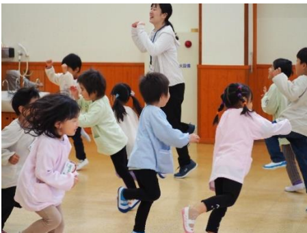
▲♪ Walking, walking, Hop, hop, hop ♪ (みかたの森こども園)