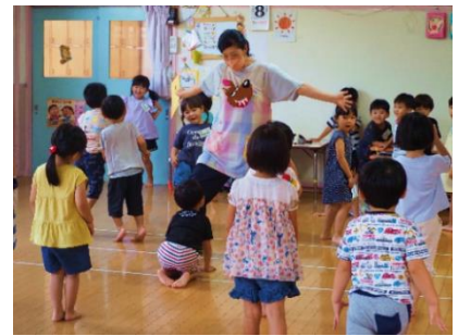
▲先生が Mr. Wolf! 楽しいな！ (豊陵保育園)