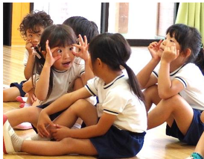
▲見てみて！Eyes！ (八条認定こども園)