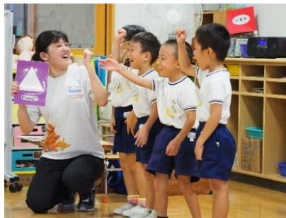
▲先生と一緒に言ってみよう！ (港認定こども園)