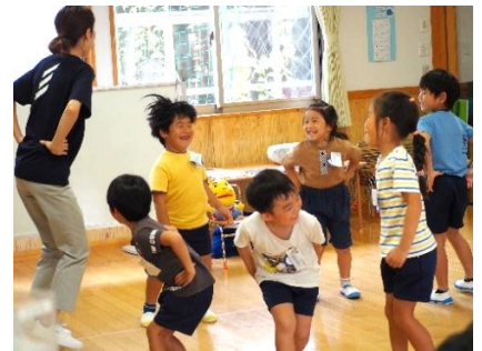
▲Hokey Pokey で Let's dance♪ (港認定こども園)