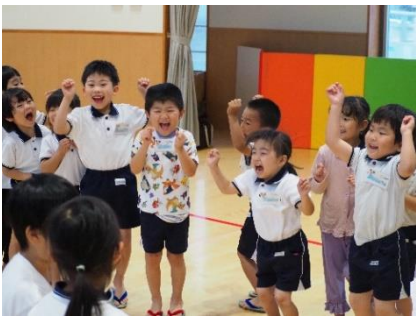
▲やったー！green があたり！ (こくふこども園)

先生方から頂いたご意見をもとに、指導内容や方法など、各指導員が工夫しながら英語遊びを進めていきます。お気づきの点など、いつでも指導員にお伝えください。