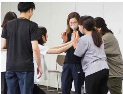
▲先生たちも英語のゲームにチャレンジ (英語遊び保育研修会)

いつも楽しく英語遊びに参加していただき、ありがとうございます。先生方の笑顔で、子どもたちが元気に英語遊びを楽しむことができます。今後ともどうぞよろしくお願いいたします。