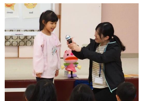
▲今の気持ちをインタビュー。Happy! (みかたの森こども園)