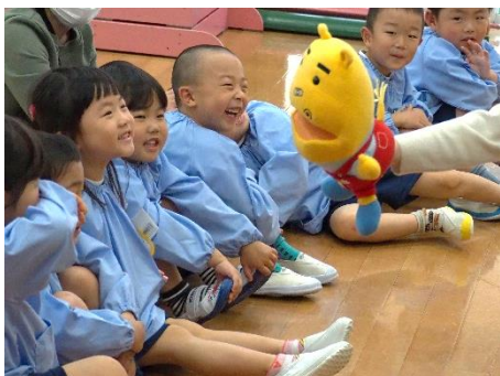
▲パペットにあいさつしてみよう。Hello! (港認定こども園)