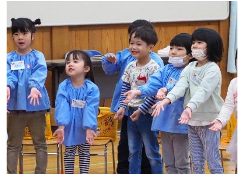
▲♪ Hello. How are you ? (おさかおのこども園)

体を動かしたり、ゲームをしたり、子どもたちや先生方と一緒に楽しい遊びを実施していきたいと思っています。子どもたちのことや、遊びに関する事など、先生方にご意見をいただきながら、より良い英語遊びにしていきたいと思っています。お気づきのことがありましたら、指導員や事務局までご連絡ください。よろしく願いいたします。