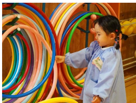
▲ここにも Pink あったよ。 (五荘奈佐幼稚園)