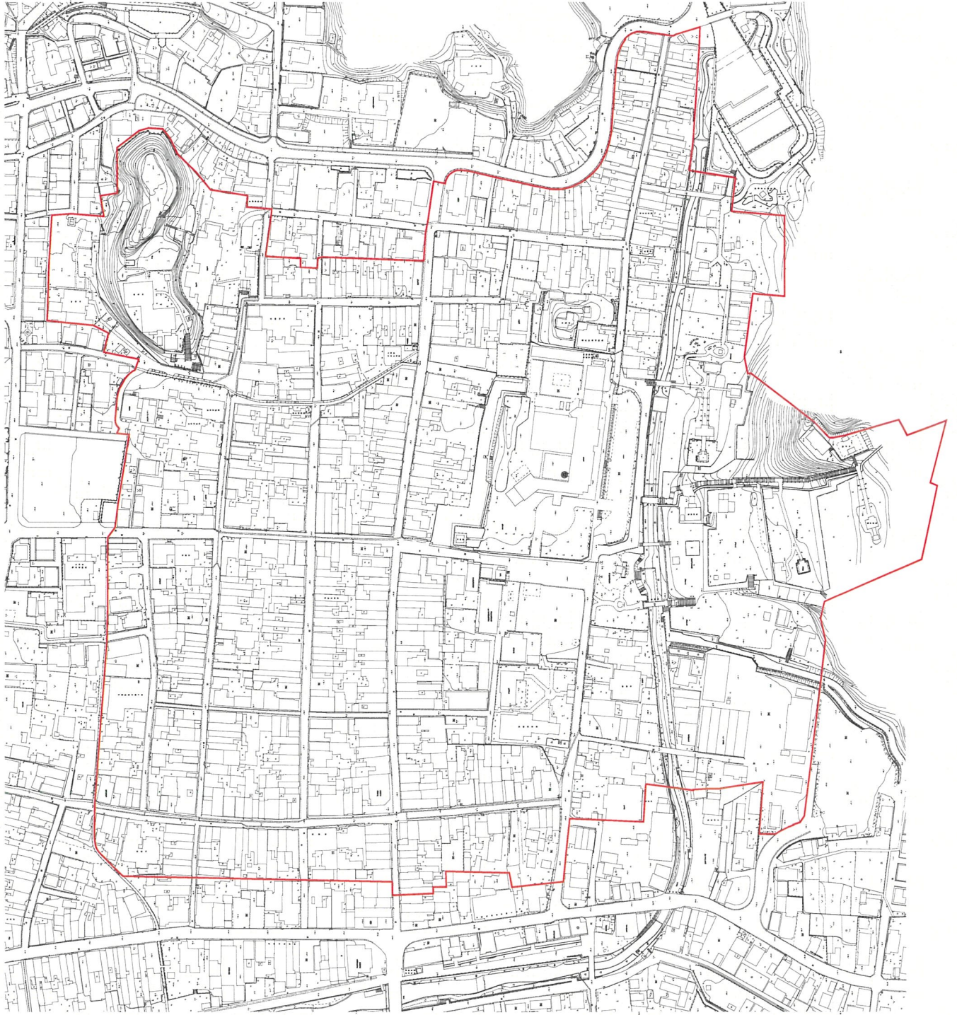
(別図 1) 保存範圍圖