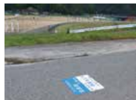
◀周辺スポット(歩キングコース) 玄武洞スポーツ公園西側の丹山川堤防 (片道4km、500mごとに標識あり)