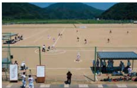
多目的グラウンド(4面)

野球、サッカー、グラウンドゴルフ、ソフトボール等の競技専用施設(駐車場・調整池・環境保全エリアも含め、9.17ha)