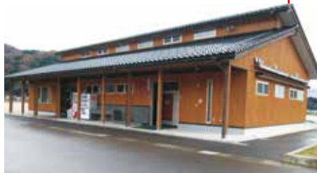
管理事務所&会議室