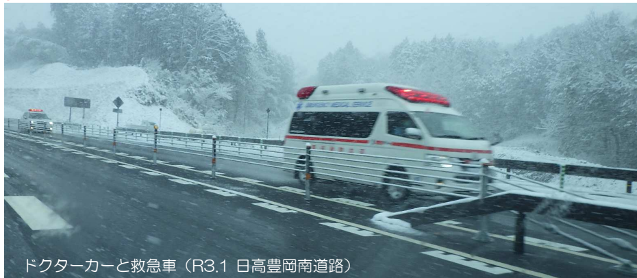
ドクターカーと救急車 (R3.1 日高豊岡南道路)