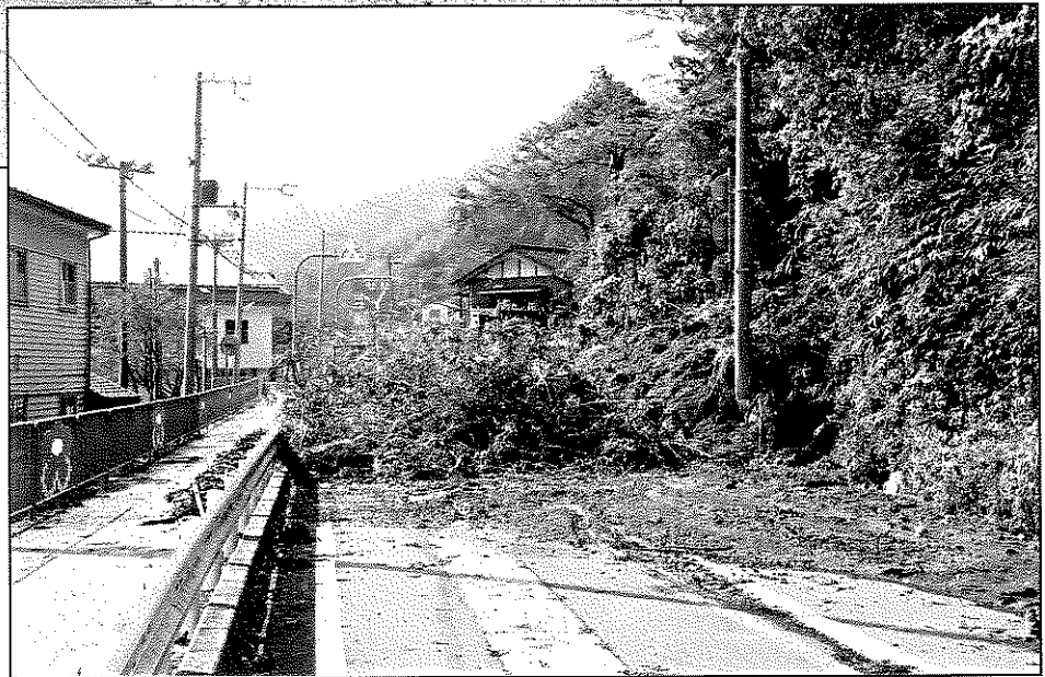
▶ 竹野町森本 崖崩れで塞がれた道路