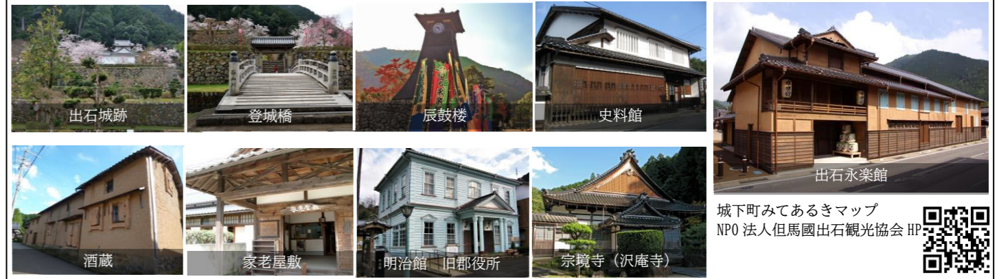
城下町みてるきマップ NPO 法人但馬國出石観光協会 HP