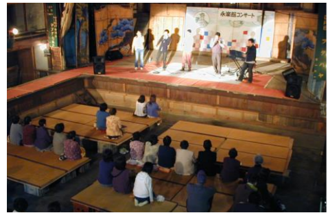
復原に向けた住民の手作りコンサート