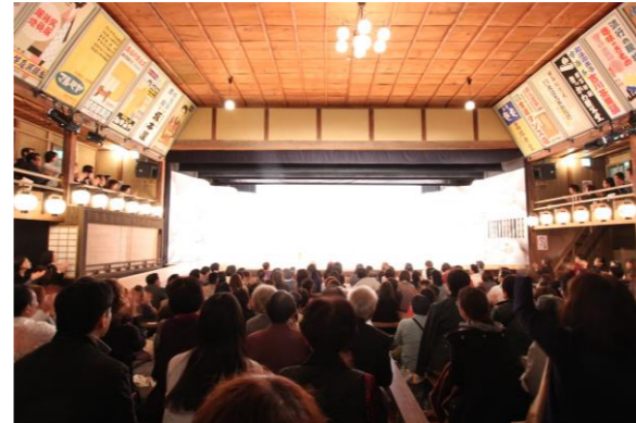
熱気あふれる、満員の客席

永楽館は、舞台装置や楽屋、客席など、明治時代に使われていたままに復原しています。客席の看板や階段の落書きなど、昔にタイムスリップしたような、懐かしい雰囲気の中で、歌舞伎をお楽しみいただけます。