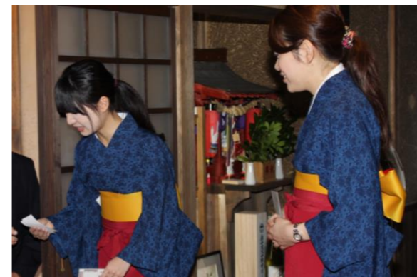
地元ボランティアのお茶子さん

永楽館歌舞伎は、地元のボランティアの方々が受付や場内アナウンス、客席案内、大向うなど、様々な場面でボランティアとして関り、町をあげて全国から来られるお客様をお迎えしています。