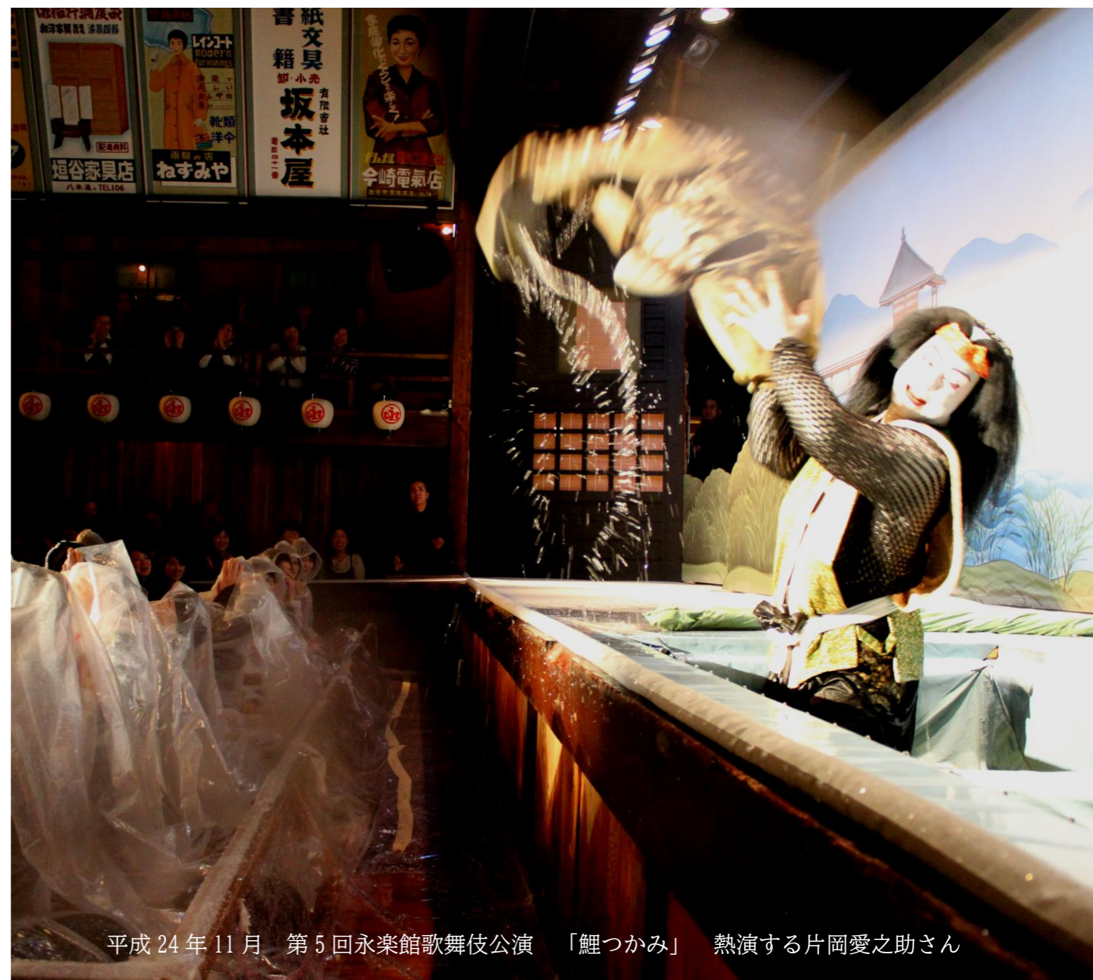
平成24年11月 第5回永楽館歌舞伎公演 「鯉つかみ」 熱演する片岡愛之助さん