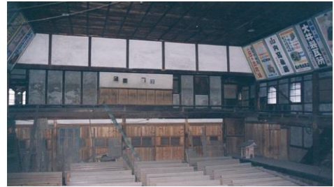
閉館後の永楽館客席