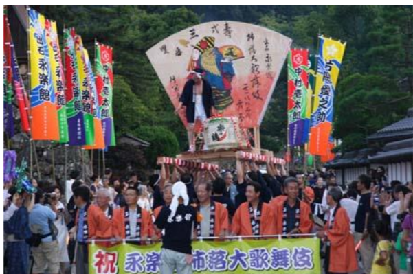
柿落し公演 前日のお練りの様子