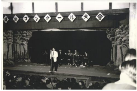
地元住民による公演