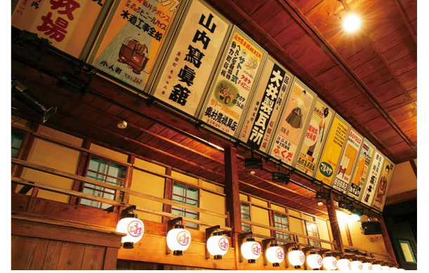
昭和初期のままの客席の看板