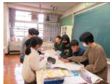
▲コミュニケーション学習（6年生）