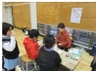
▲生活科授業（1・2年生）