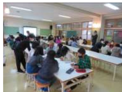
▲交通安全教室（4・5年生）