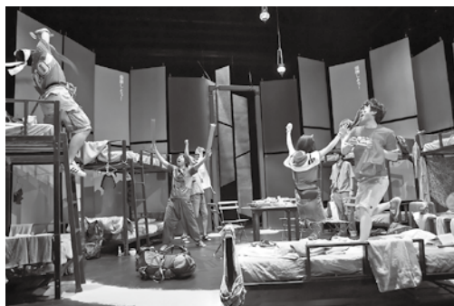
新・冒険王(2015)青年団 ©TsukasaAoki

アーティストやクリエイターに住んでもらえる、選ばれるまちを創りつつ、アーティストやクリエイターが移住しやすいように、住まいや仕事の情報を提供したり、作品を創作しやすい環境づくりの検討を進めているところなんじや。これから豊岡がどんなまちになっていくのか、ワクワクするの。