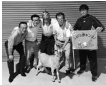
ヤギの“はなこと愉快なおっさんたち

職場の仲間で5人1組のチームを作り、市内20チームが10月の1カ月間の総歩数を競い合う、第7回豊岡市「職場対抗“歩キング”選手権」を開催しました。優勝