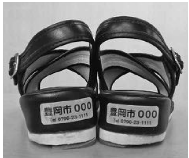
登録番号付き反射ステッカー

行方不明者が発生した場合、迅速に対応するため、少しでも多くの方の協力と、とよおか防災ネットへの登録をお願いします。