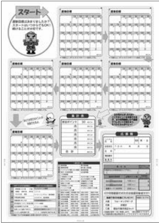
▶運動健康ポイントシート