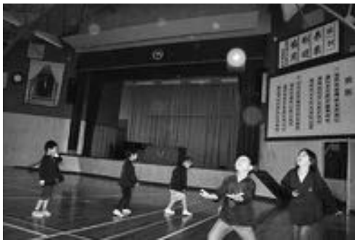
▲寄付されたポイントでボールを購入(竹野小)