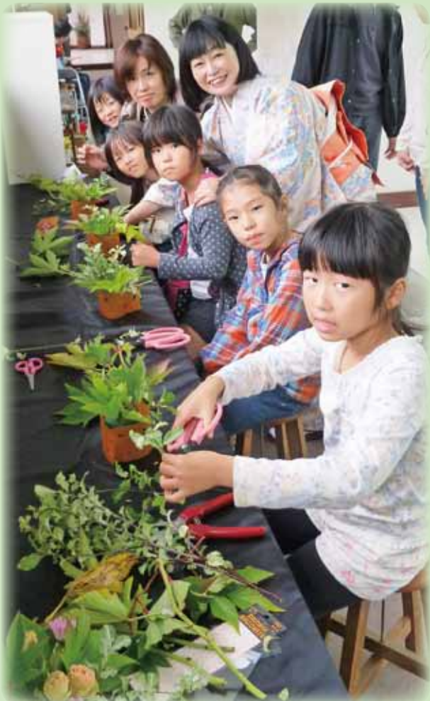
子どもたちも挑戦! 「お花のアトリエ」コーナーにて (三原谷の川の風まつり・竹野町)

詳細 募集の詳細は、市ホームページの「市議会>市議会トピックス>議会だより写真募集(平成28年12月~)」をご覧ください。