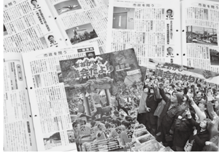
年5回発行の議会だより

「とよおかし議会だより」の年間発行回数、定例会後の4回と、11月の臨時会後の計5回です。市民の皆さまに市議会の活動状況を伝えるとともに、議会に対する関心を高めていただくため、読みやすく、わかりやすく、親しまれる広報紙発行を目指しています。