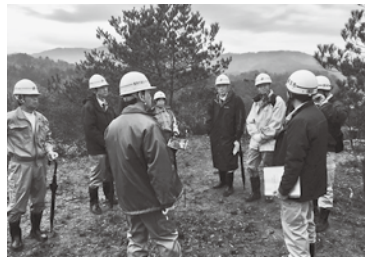
災害時の連携道路の整備要望があった現場を視察する委員（五荘地区）

風23号以来大きな自然災害は発生していません。しかしその反面、当時の事情が風化してきていることへの懸念が増大してきています。あの台風の年に生まれた子どもたちは、はやくも中学生になります。