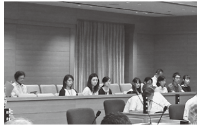
ぜひ、傍聴へお越しください！

主に議員間や各委員会と市当局との協議・議論などの調整、円滑な議会の運営を責務とし、そのための条例や規則の整備を行い、また議長諮問に応じてさまざまな案件の調査・研究を行っています。昨年に引き続き「議会