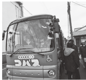
地域公共交通に欠かせないコバス

北近畿自動車道は、八鹿日高道路9・7 km、日高神鍋高原ICまで本年3月25日の開通を目指し工事進捗中です。山陰近畿自動車道は、浜坂道路9・8 kmが29年度供用予定。第一回