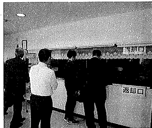
かみなべ 「神鍋フェアー」など開催する 「飲食部門」