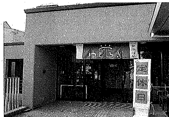
神鍋温泉「ゆとろぎ」